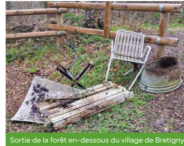
Sortie de la forêt en-dessous du village de Bretigny