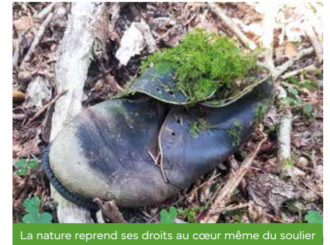
La nature reprend ses droits au cœur même du soulier